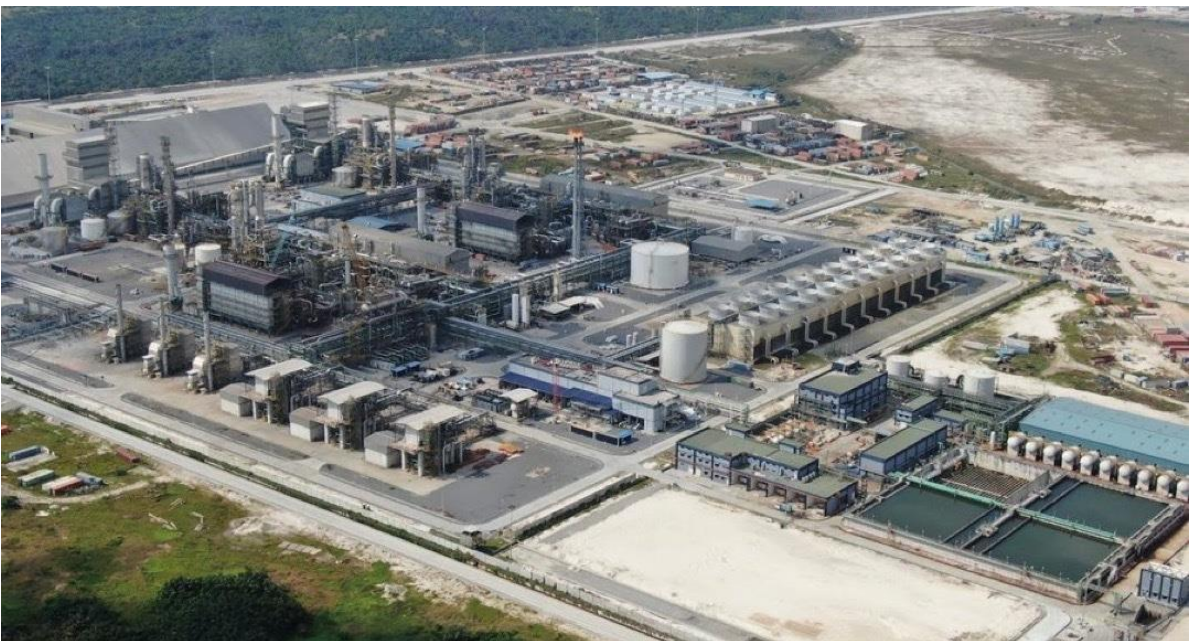
The Dangote Fertilizer plant in Nigeria